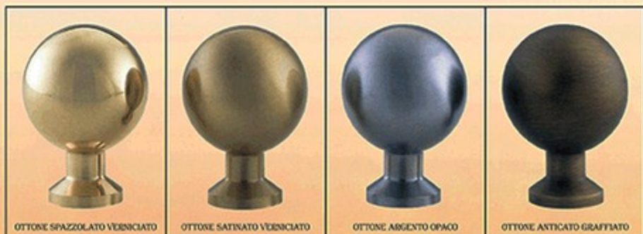
ART. U 2