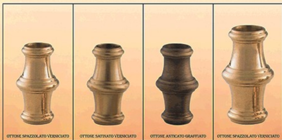
OTTONE SPAZZOLATO VERNICIATO