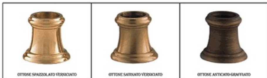
OTTONE SPAZZOLATO VERNICIATO